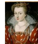
Louise de Lorraine

12) Qui sont-elles ? La réponse est dans cette chambre du château.