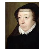
Catherine de Médicis