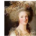
Élisabeth de France