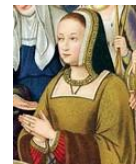
Anne de Bretagne