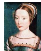
Claude de France