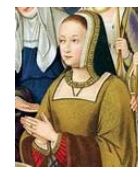
Claude de France

Amboise est une terre d'équilibre, nichée au cœur de la Touraine. La ville incite aux songes, accueille Reines et Rois. Édifié au XV e et XVI e siècles par Charles VIII, Louis XII et François Ier, le château est la première résidence royale de la Renaissance Française. Charles VIII est le seul roi de France à être né et mort à Amboise. Marié à Anne de Bretagne, ils n'ont pas d'enfants et il meurt jeune, en se rendant à un jeu de paume, en passant par la galerie Hacquelebac.