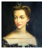
Diane de Poitiers