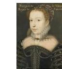
La Reine Margot

Au premier étage de ce château, une chambre fait référence aux cinq Reines (les deux filles de Catherine de Médicis et ses trois belles-filles). Les armories de ces cinq Reines sont incrustées dans le somptueux plafond à caisson du XVIIème siècle.