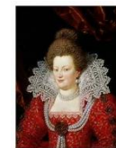
Marie de Médicis